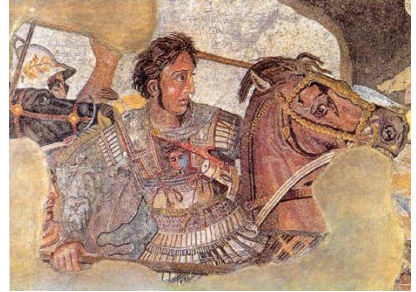
อเล็กซานด้ามหาราช อาณาจักรกรีก

กษัตริย์ ไซรัส เป็นคนมีดี (Mede) ท่านเป็นนักรบที่มีอัจฉริยภาพมากมาย ความเก่งกาจ สามารถได้มาถึงจุดสูงสุด เมื่อท่านได้ครอบครองกรุงบาบิโลน แทบจะกล่าวได้ว่า ไซรัสรองทั้งโลก เป็นอาณาจักรยิ่งใหญ่ อย่างที่ไม่เคยปรากฏมาก่อน ถึงแม้ว่า ไซรัส จะครองโลก แต่ใครปกครองเหนือ ไซรัส อีกที?